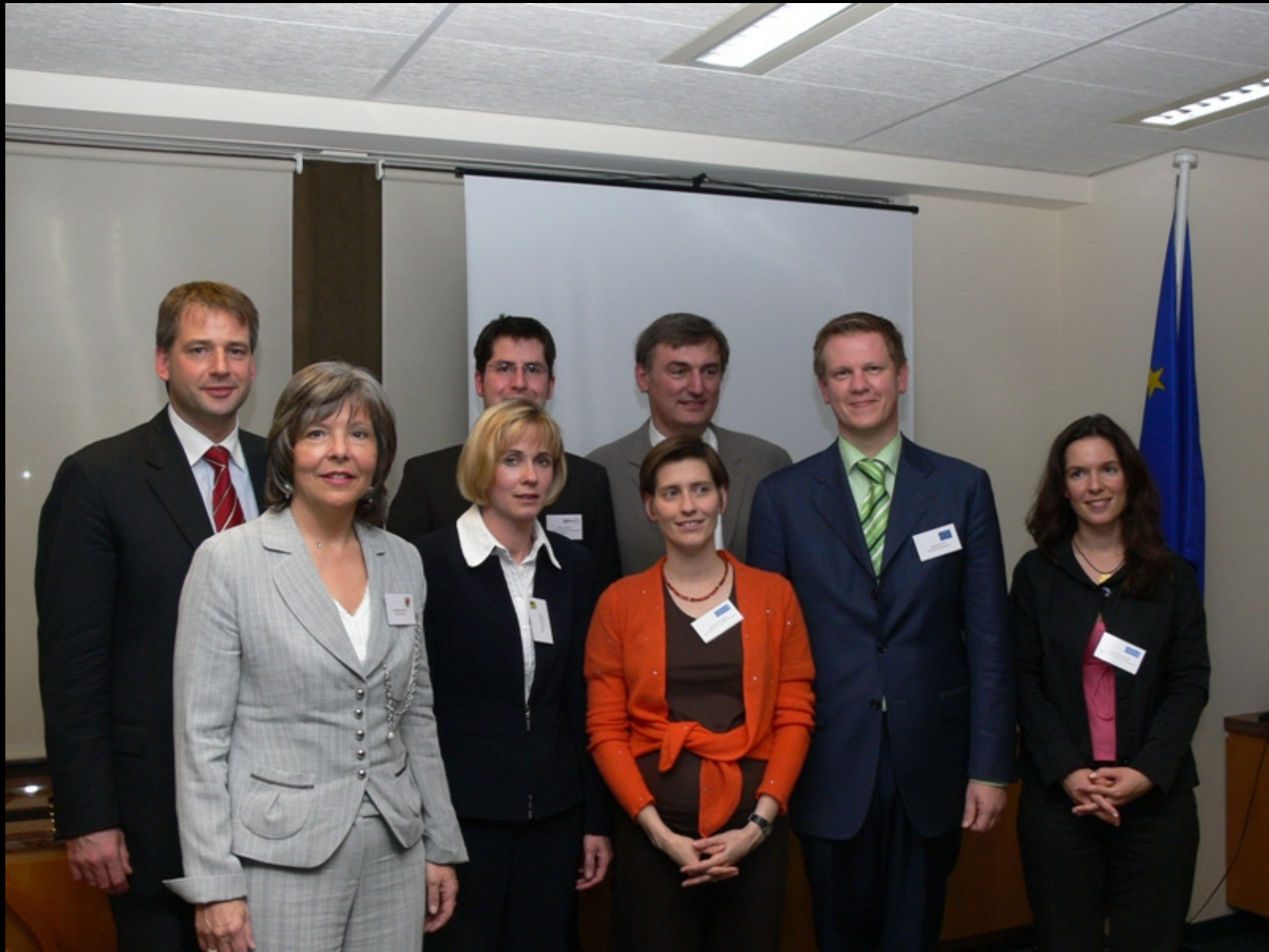
Gruppenfoto mit Referenten und Leitern der Europabüros